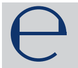
e-Zeichen auf Fertigpackungen

Der Grundpreis (Preis je Mengeneinheit, z.B. 20,95 €/kg) ist in unmittelbarer Nähe des Endpreises anzugeben. Die Angabe des Grundpreises ist auch in der Werbung erforderlich. 3)